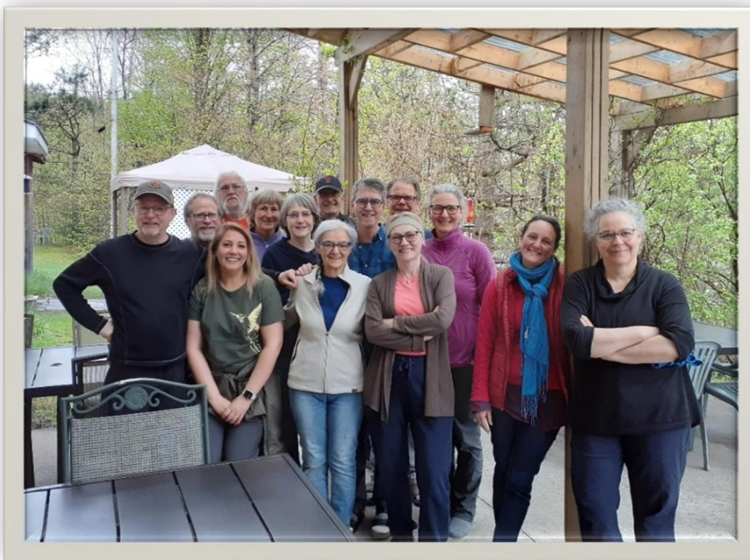
Médit-action printemps 2024

Un grand merci à toutes ces personnes qui offrent généreusement leur temps. Leur apport est indispensable et permet de continuer d'offrir nos services de qualité, un lieu accueillant, propre, une présence bienveillante lors des activités.