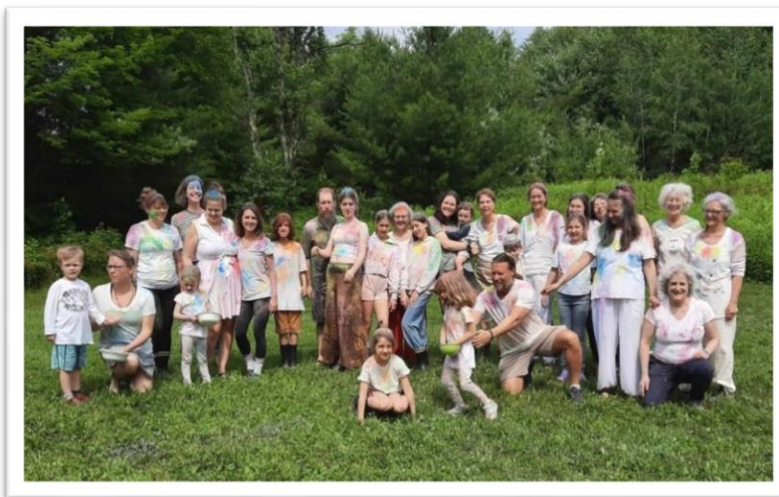
Le groupe réuni pour la célébration du solstice d'été 2024

En 2024, on a reçu 4 personnes, ce fut plutôt tranquille et très agréable.