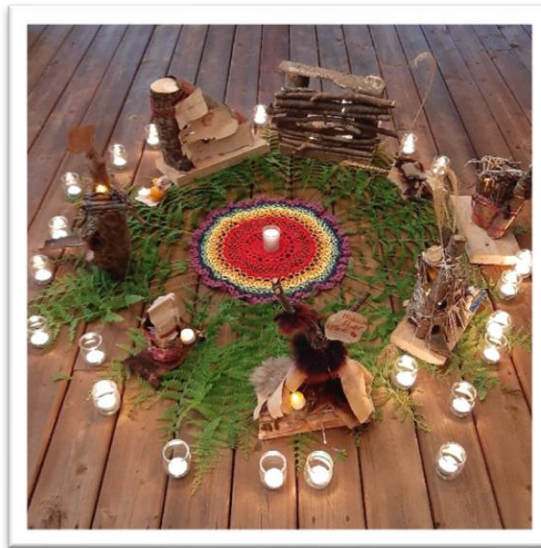
Les maisons de fées fabriquées à partir d'éléments de la nature

Une première expérience d'une fin de semaine avec des enfants et des familles dans l'intention de leur permettre de goûter à l'atmosphère du centre et à la magie de la forêt de L'Arc-en-ciel. Les fées étaient au rendez-vous et nous leur avons fabriqué de magnifiques maisons.