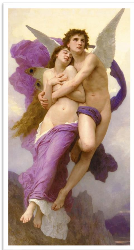
Le ravisement de Psyché Tableau de William Bouguereau

Pour la seconde fois, c'est le mythe d'Éros et Psyché qui formait le fil conducteur du séminaire et l'intention qui nous habitait était : aimer ici et maintenant . Nous nous sommes identifiés à Psyché qui, après une longue errance et bien des épreuves, devient capable d'aimer véritablement en s'unissant à sa partie divine, représentée par le dieu Éros.