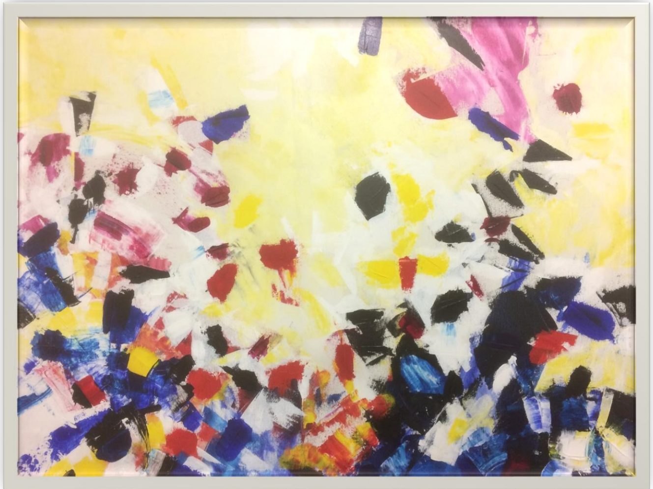
Acrylique sur toile d'André Fortin